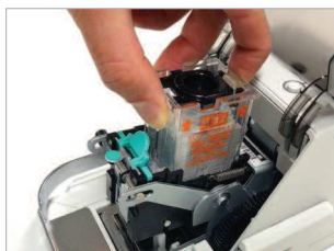
Changement facile et rapide de la cartouche d'agrafes.